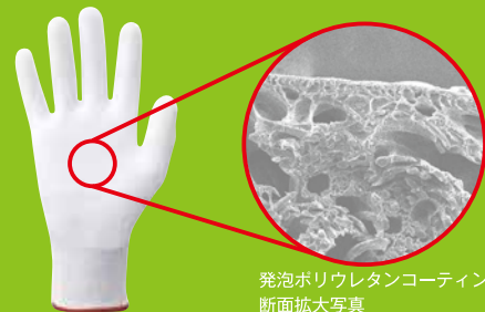
発泡ポリウレタンコーティング 断面拡大写真