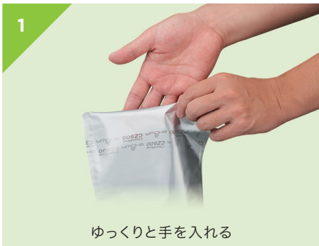
ゆっくりと手を入れる