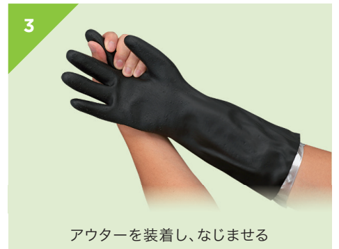
アウターを装着し、なじませる

※ご使用前には必ず、手袋にキズ・ピンホール・破れ等がないか、よく確かめてください。 ※勢いよく手を入れたり、左右の指を組んで握らないでください。手袋が破れるおそれがあります。