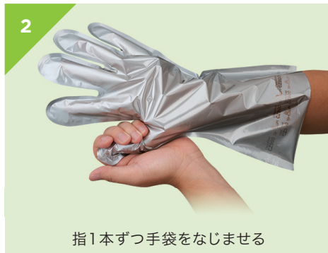
指1本ずつ手袋をなじませる